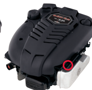
600 Series, 800 Series Quantum, Intek