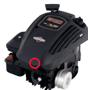
400 Series, 500 Series Classic, Sprint, SQ, Q